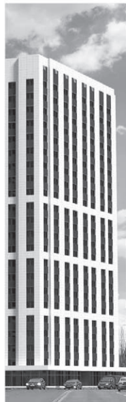
ЖК по ул. 45 СТРЕЛКОВОЙ ДИВИЗИИ