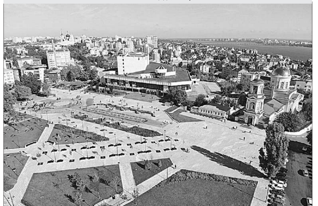
Советская площадь, г. Воронеж

– Если в общих чертах, то целый комплекс землеустроительных, согласительных и правовых процедур. Специалисты учреждения, действительно, одни из первых в Российской Федерации провели указанные работы в полном объеме, в результате чего была создана уникальная практика, отработаны юридические механизмы прохождения всех процедур по утверждению границ. На сегодняшний день установлены и внесены в ЕГРН сведения о шести участках границы Воронежской области по смежеству с Курской, Липецкой, Ростовской, Тамбовской, Саратовской и Волгоградской областями. До конца текущего года планируется завершить работы по границе с Белгородской областью.